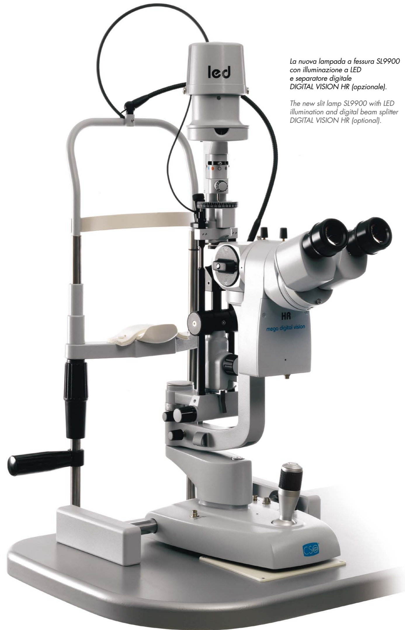
La nuova lampada a fessura SL9900 con illuminazione a LED e separatore digitale DIGITAL VISION HR (opzionale).

The new LED illumination source makes the examination very comfortable, because the emitted heat is negligible at all. The life of the LED is longer than 50000 working hours and its color temperature is constant in each situation. This reduces the maintenance of the device and provides very bright and clear pictures with each magnification factor. The LED source is powered and controlled by an electronic system that provides its best performances and integrates also a faults detection.